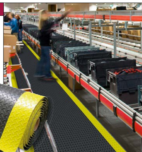
Umlaufend abgeschrägte Kanten, gelber Sicherheitsrand und Anti-Rutsch-Beschichtung RedStop™ auf der Unterseite