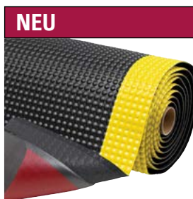
NEU Gelber Sicherheitsrand, rundherum abgeschrägte Kanten und rutschfeste Unterseite RedStop™