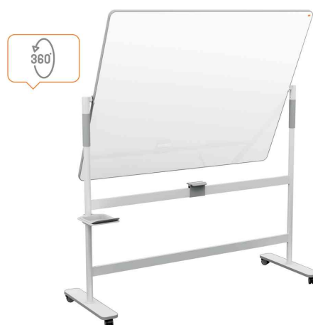
Tableau rotatif à pied mobile Move & Meet