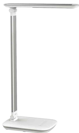
Lampe de bureau à LED MAULjazy, blanc