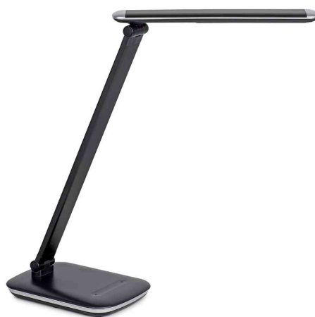
Lampe de bureau à LED MAULjazy, noir