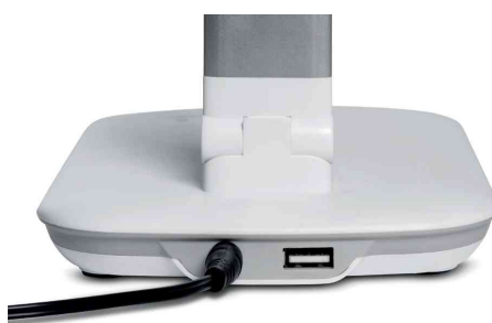
Vue détaillée: port USB