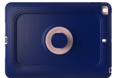
SPACE EXPLORER 77-83272 840104262924