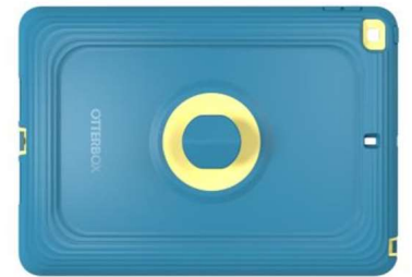
GALAXY RUNNER 77-83271 840104262917