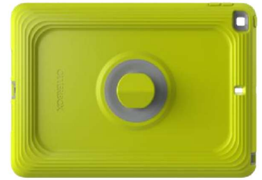
MARTIAN 77-83270 840104262900