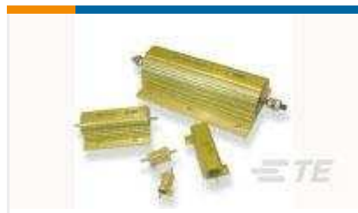
TE Teilnr.:1676625-7 HSA25 5R0 5%