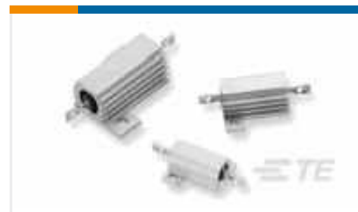
TE Teilnr.:2-1879075-4 THS25 10R 5%