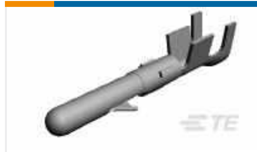
TE Teilnr.:60618-5 CMNL PIN AUBR L/P