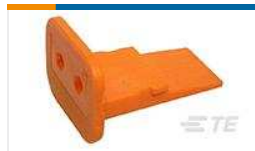
TE Teilnr.:W2S WEDGE LOCK, 2P, PLG, ORG, STD, DT