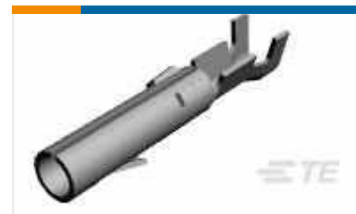
TE Teilnr.:60617-5 CMNL SOK AUBR L/P