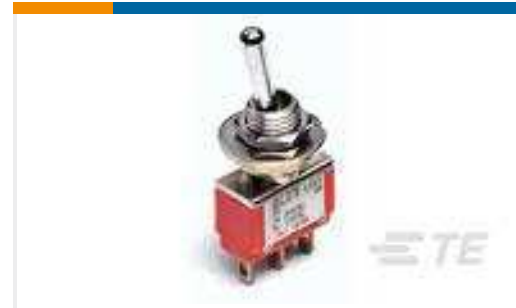
TE Teilnr.:1-1825139-0 A203SYZQ04