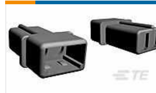
TE Teilnr.:1-480724-0 02P CMNL CAP HSG F/H D/L NATL