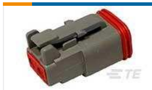
TE Teilnr.:DT06-2S PLG, 2P, GRY, N