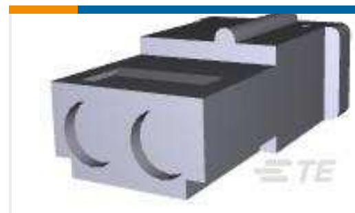
TE Teilnr.:1-480683-0 02P CMNL PLUG HSG F/H NATL