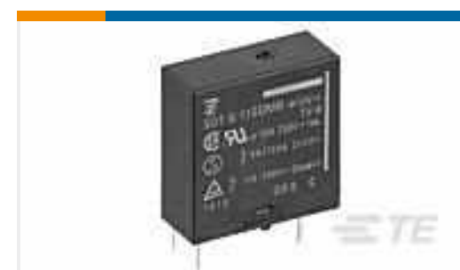
TE Teilnr.:8-1419125-5 SDT-S-106LMR,000