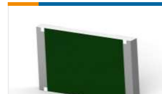
TE Teilnr.:8-2176407-8 3560 27R 5%