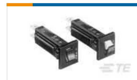
TE Teilnr.:1-1393250-7 W28-XQAT-15=W28