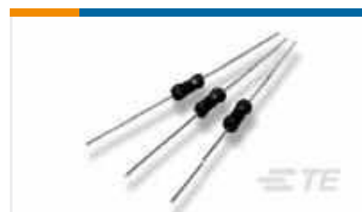
TE Teilnr.:4-1879350-2 RR01 5% 11R AMMO