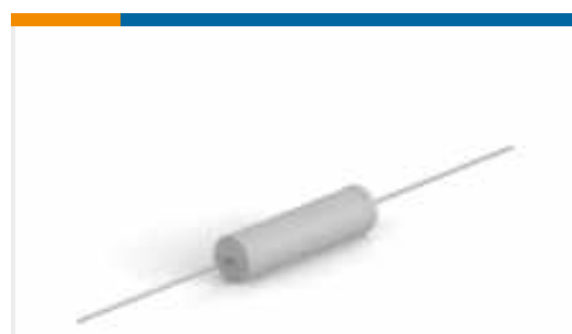
TE Teilnr.:4-2176414-8 7W STD M/OX 5% 1K8