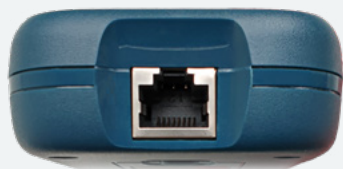
↑ RJ45 Test-Port (Koax über optionalen Adapter)