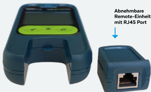
↓ Abnehmbare Remote-Einheit mit RJ45 Port