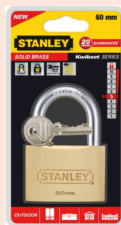
Visuel de référence: Cadenas KWIKSET SERIE, sous blister