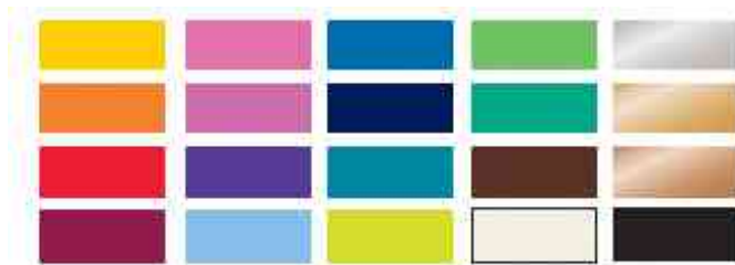
Aperçu des couleurs