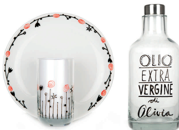
Visuel de référence: exemple d'utilisation