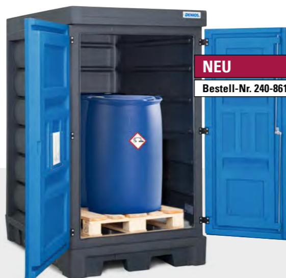
NEU Bestell-Nr. 240-861-J0

Das PolySafe-Depot Typ D ist großzügig dimensioniert. Somit können z.B. Abfülltätigkeiten direkt am Depot vorgenommen werden.