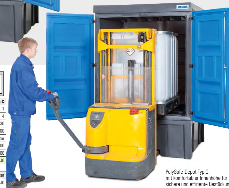
PolySafe-Depot Typ C, mit komfortabler Innenhöhe für sichere und effiziente Bestückung