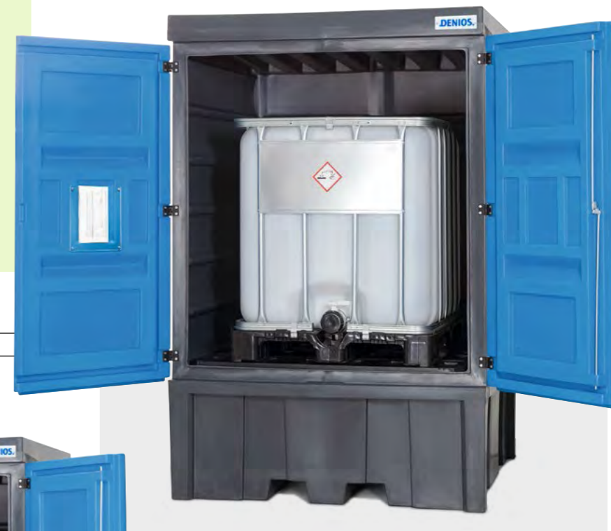
PolySafe-Depot Typ C, zur Lagerung von 1 IBC à 1000 Liter