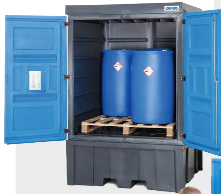
PolySafe-Depot Typ C, zum Einstellen von bis zu 4 Fässern à 200 Liter auf einer Chemiepalette