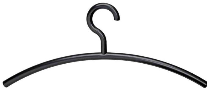
Cintre en plastique, noir