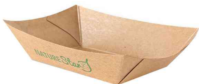
Visuel de référence : barquette à snack Tasty