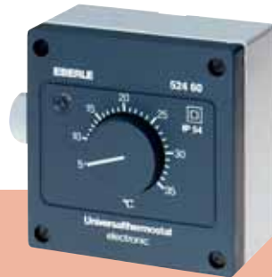
AZT-A 524 510 / AZT-A 524 410