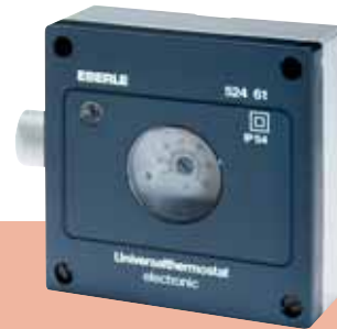
AZT-I 524 510 / AZT-I 524 410