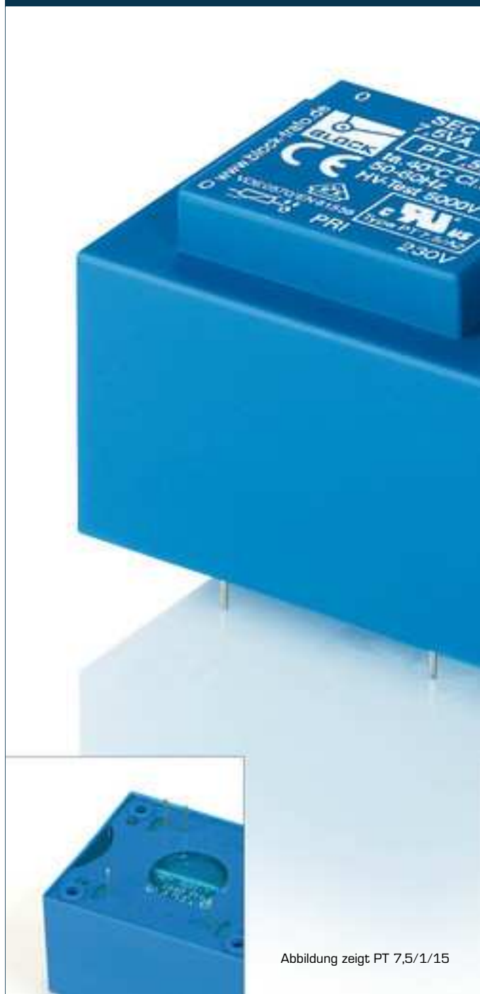
Abbildung zeigt PT 7,5/1/15