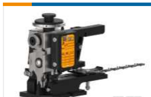
TE Teilenummer2150488-1 OCEAN_2.0_Applicator-E-110F152F