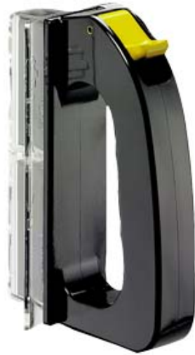
AUFSTECKGRIFF FUER NH-SICHERUNG GR.000 BIS 4