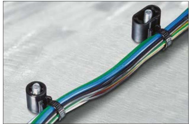
Diese außenverzahnten Kabelbinder führen den Kabelstrang direkt an den Schweißbolzen.