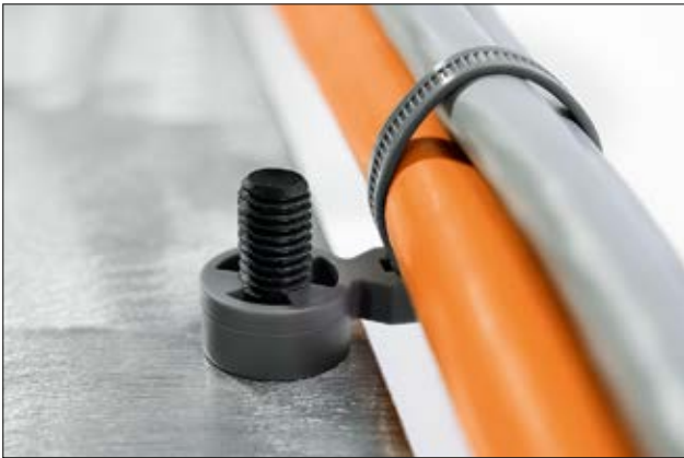
Befestigungsbinder T50SOSSBU für Bündel, die unterhalb des Schweißbolzens geführt werden.