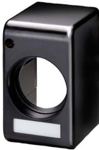
DIAZED-ISOLIERSTOFFKAPPE DII/25A E27