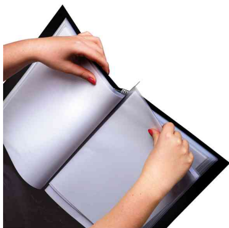
rillstab Mechanik: Einfacher Austausch der Hüllen