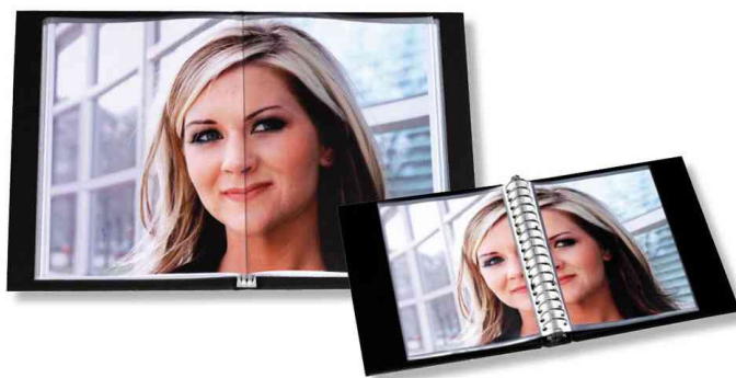
Vorteil: Blättern wie in einem Buch!