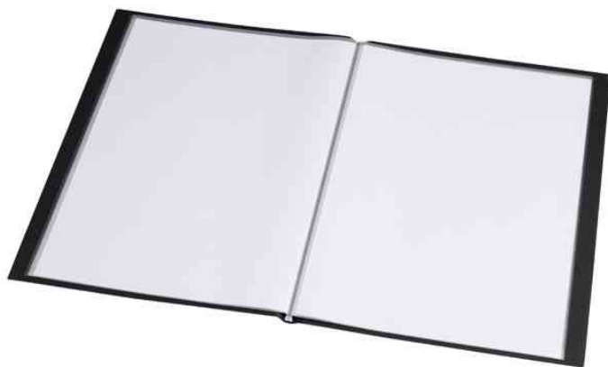
Sichtbuch "Original", DIN A4, offen