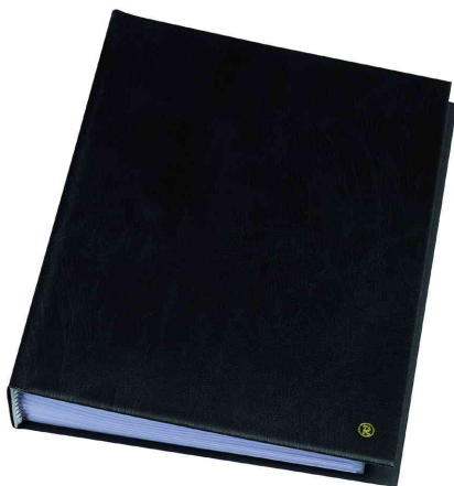
Sichtbuch "Original", DIN A4