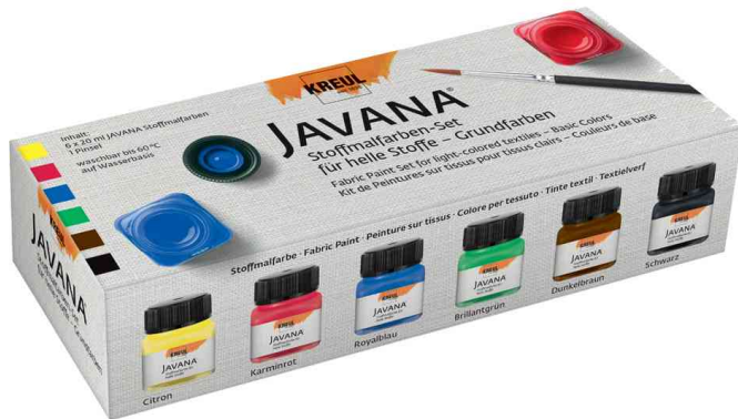
Textilfarbe JAVANA, Grundfarben-Set