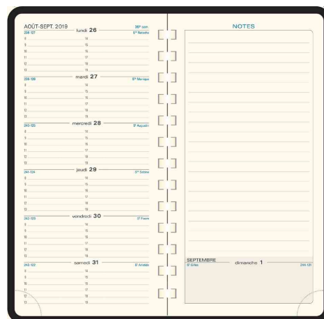
Agenda semainier de poche "Espace 17 S" - 175 x 90 mm, grille