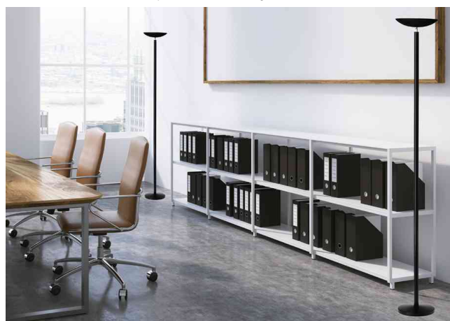
Visuel de référence : présente le produit en utilisation