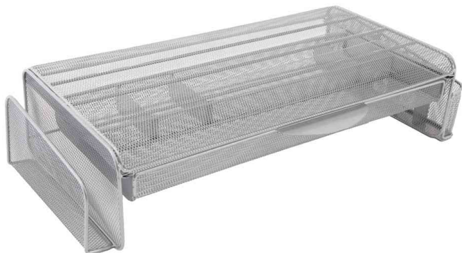
Support pour écran MESHUP M, gris