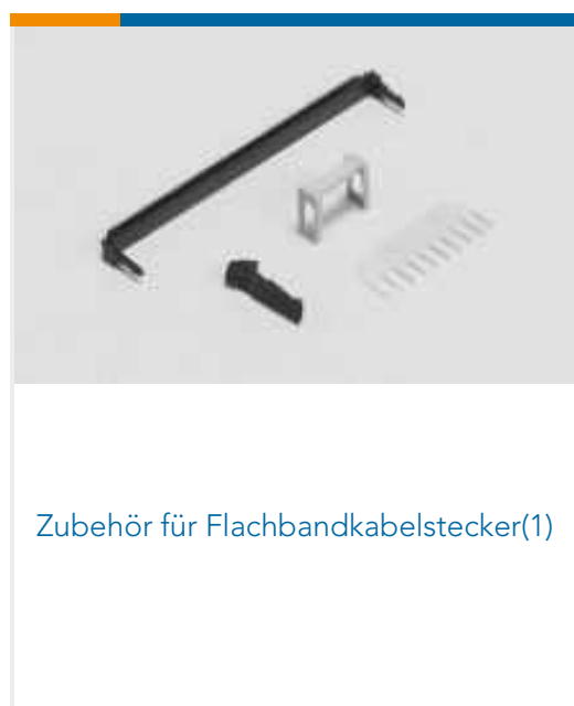
Zubehör für Flachbandkabelstecker(1)