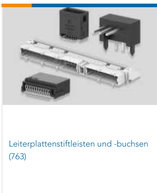
Leiterplattenstiftleisten und -buchsen (763)