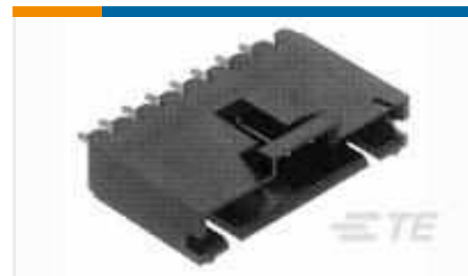
TE Teilnr.:1-103908-1 12 MTE HDR SRST LATCH W/HLDWN