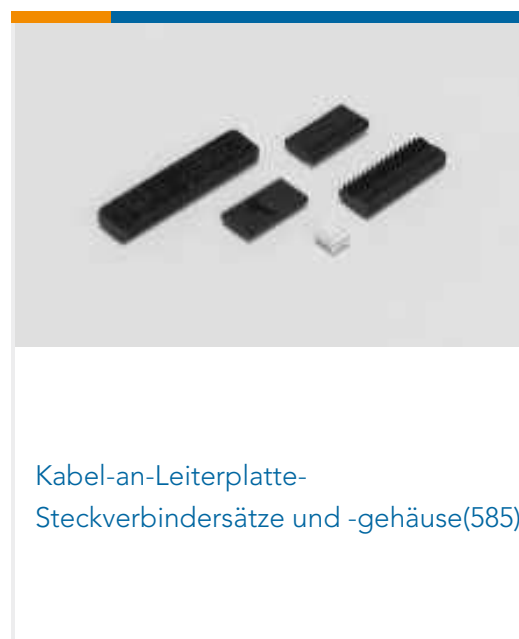
Kabel-an-Leiterplatte- Steckverbindersätze und -gehäuse(585)