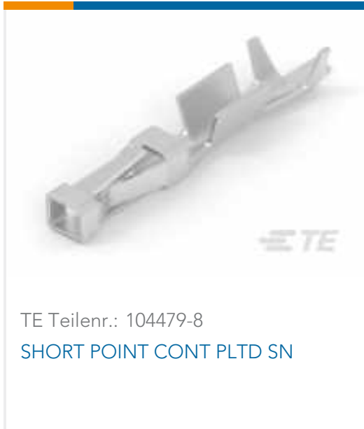
TE Teilnr.: 104479-8 SHORT POINT CONT PLTD SN