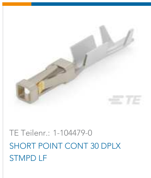
TE Teilnr.: 1-104479-0 SHORT POINT CONT 30 DPLX STMPD LF