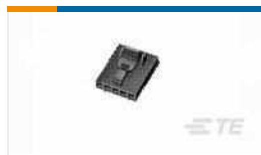
TE Teilnr.:104257-7 08 MTE RCPT HSG SR LATCH .100