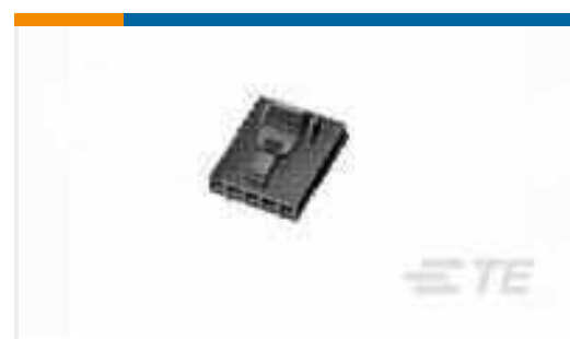
TE Teilnr.:1-104257-5 16 MTE RCPT HSG SR LATCH .100