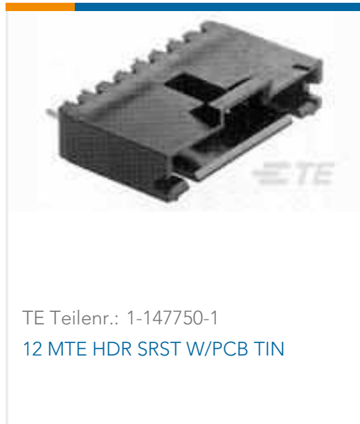
TE Teilnr.: 1-147750-1 12 MTE HDR SRST W/PCB TIN