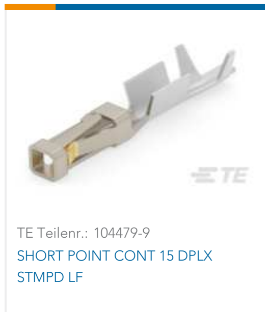
TE Teilnr.: 104479-9 SHORT POINT CONT 15 DPLX STMPD LF