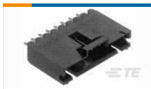
TE Teilnr.:103669-1 02 MTE HDR SRST LATCH W/HLDWN