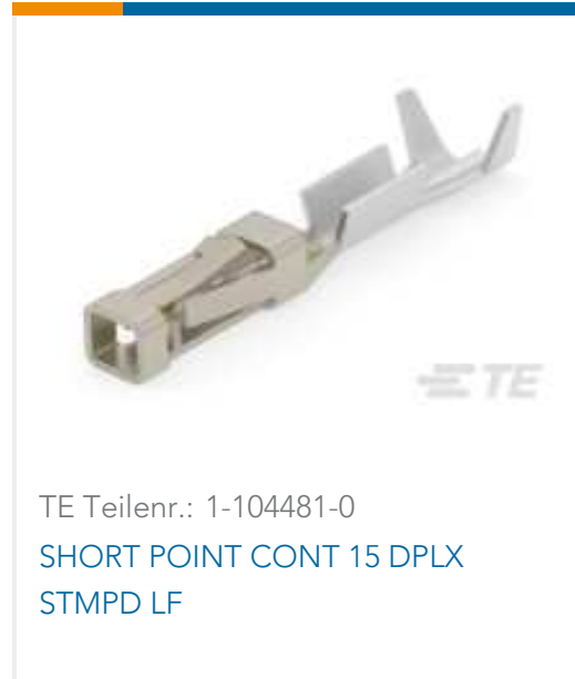
TE Teilnr.: 1-104481-0 SHORT POINT CONT 15 DPLX STMPD LF