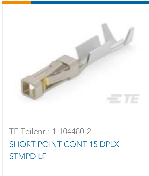
TE Teilnr.: 1-104480-2 SHORT POINT CONT 15 DPLX STMPD LF