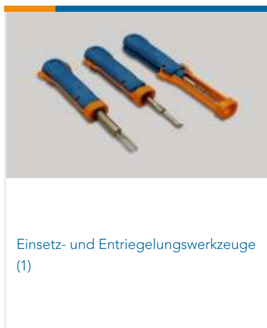
Einsetz- und Entriegelungswerkzeuge (1)