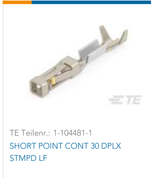
TE Teilnr.: 1-104481-1 SHORT POINT CONT 30 DPLX STMPD LF