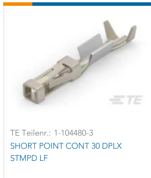
TE Teilnr.: 1-104480-3 SHORT POINT CONT 30 DPLX STMPD LF