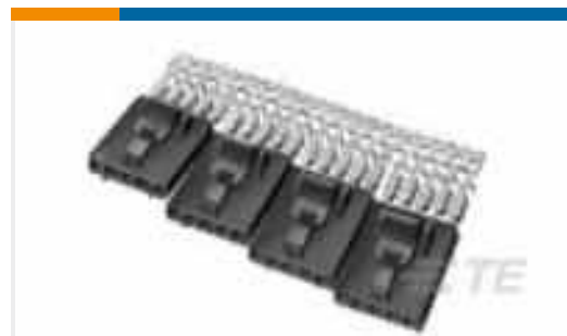
TE Teilnr.:1-103644-5 16 MTE RCPT SR LATCH .100CL