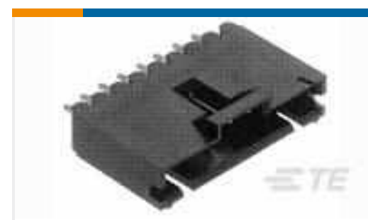
TE Teilnr.:103669-2 03 MTE HDR SRST LATCH W/HLDWN