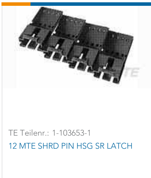
TE Teilnr.: 1-103653-1 12 MTE SHRD PIN HSG SR LATCH