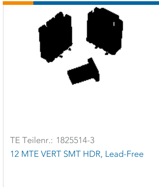
TE Teilnr.: 1825514-3 12 MTE VERT SMT HDR, Lead-Free