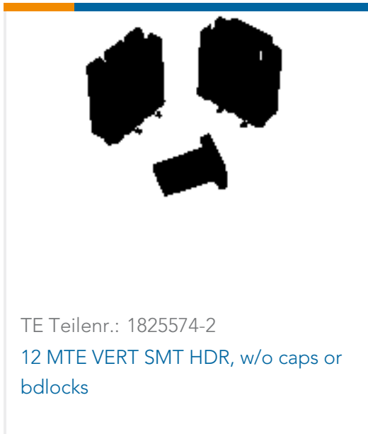
TE Teilnr.: 1825574-2 12 MTE VERT SMT HDR, w/o caps or bdlocks