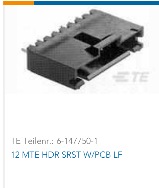
TE Teilnr.: 6-147750-1 12 MTE HDR SRST W/PCB LF