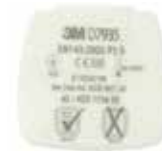
D7935 P3 R