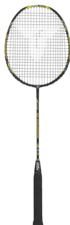
Raquette de badminton ARROWSPEED 199