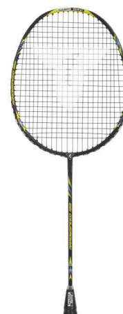
Raquette de badminton ARROWSPEED 199, vue détaillée