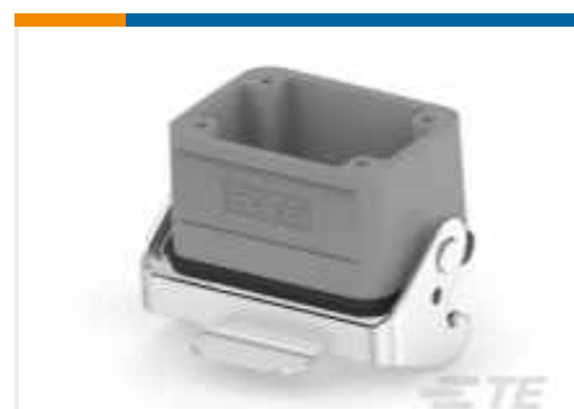
TE Teilnr.:T1730060000-000 H6B-TBF-T