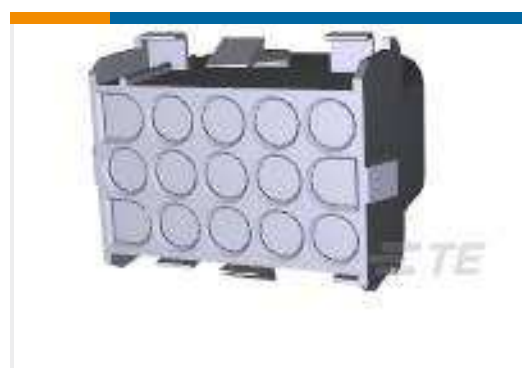
TE Teilnr.:1-480711-9 15P UMNL CAP HSG BLK