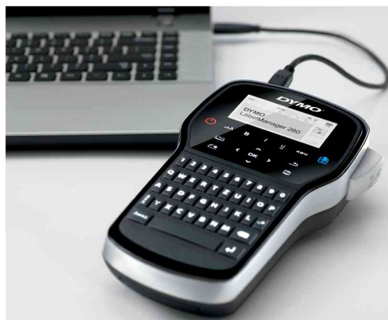
Visuel de référence : exemple d'utilisation