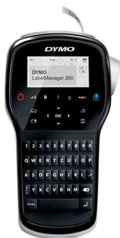
Etiqueteuse manuelle "LabelManager 280"