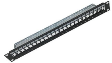
110-0209 Panneau de brassage 1U, 24 ports Keystone vide