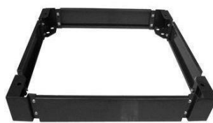
110-0183 Plinthe 600x800mm Hauteur 100mm