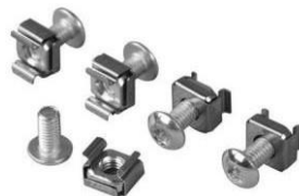
110-0180 Kit de 50 vis à cage pour rack Type M6 Philips