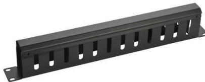
110-0188 Bandeau de gestion de câbles Type métallique, avec couvercle, 1U