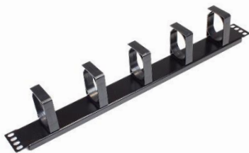
110-0201 Bandeau de gestion de câbles Anneaux en plastique, 1U