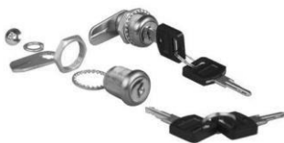
110-0178 Serrure avec clé