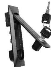
110-0177 Poignée rétractable avec clé