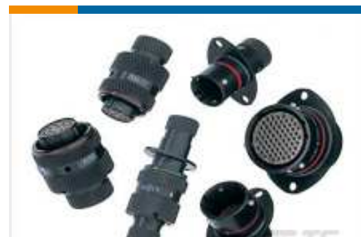
TE Teilnr.:AS012-98SA RECEPT.2 HOLE MNT.TYPE 0