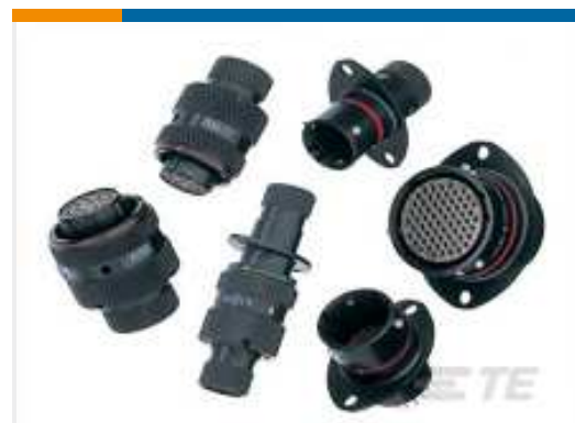
TE Teilnr.:AS212-98PN 2 HOLE FLANGE RECEPT