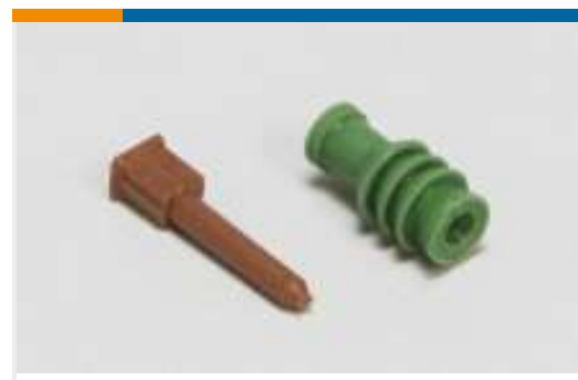
Dichtungen und Blindstopfen(2)