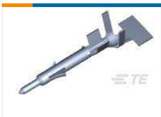
TE Teilnr.:171636-1 MINI U-M-N-L PIN CONTACT