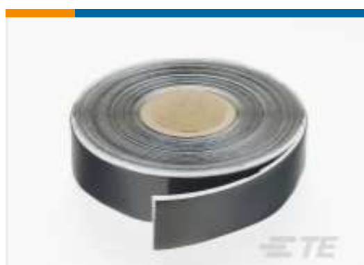
TE Teilnr.:095226-000 S1030-TAPE-3/4X33FT