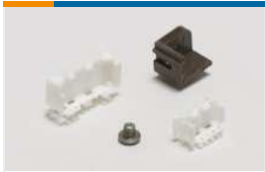
Montage von Leiterplatten-Steckverbindern(1)