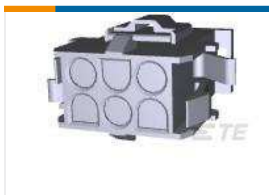
TE Teilnr.:770027-1 06P UMNLI IN-LINE CAP HSG KIT