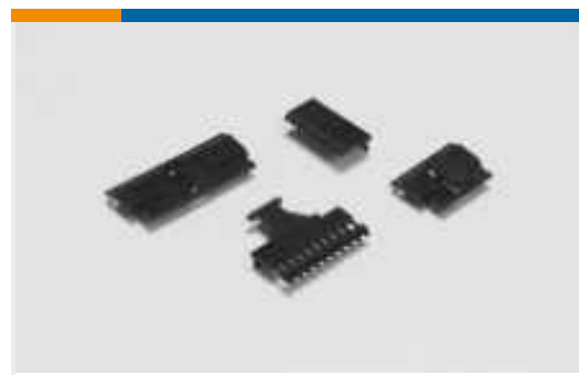
Abdeckungen für Leiterplatten-Steckverbinder(88)