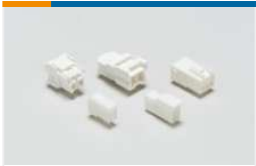
Rechteckige Leistungssteckverbinder (697)