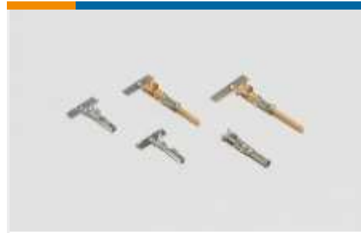
Kontakte für Leistungssteckverbinder(3)