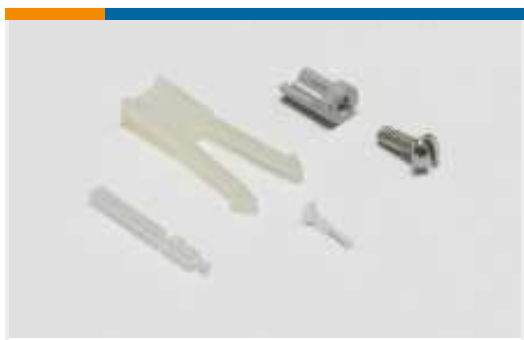
Kodierungen für Leiterplatten-Steckverbinder(2)