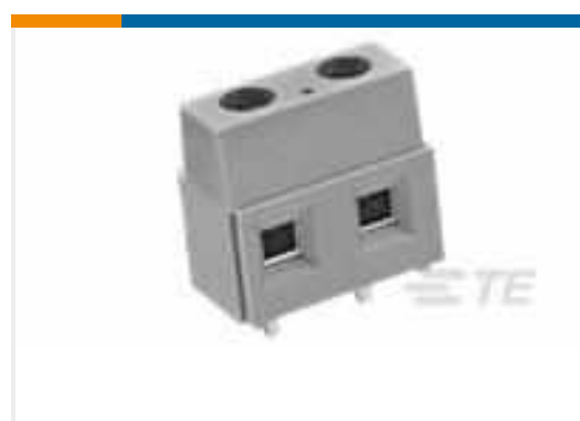
TE Teilnr.:796740-2 2 POS PCB MT 6.35MM HI CRT TBK