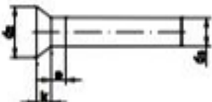
DIN 661 = Senkniete