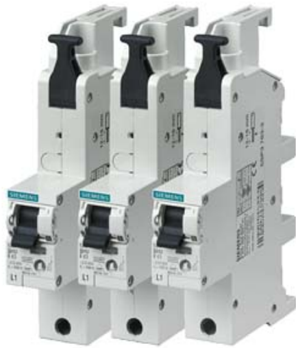
HAUPTLEITUNGSSCHUTZSCHALTER (SHU), 1-POLIG, E 25A, 230/400V (SATZ MIT L1,L2,L3)