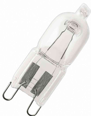
Visuel de référence: Ampoule halogène HALOPIN® PRO