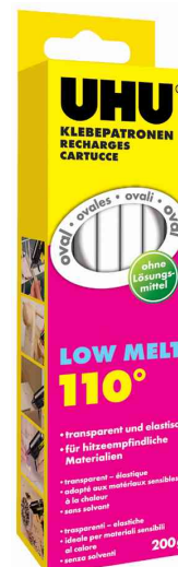
Recharge de colle Low Melt, 200 g