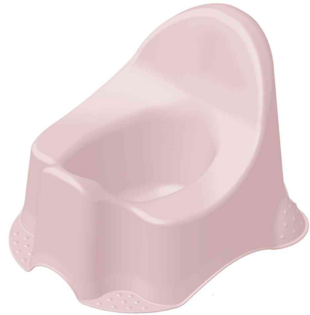
Comfort Babytopf "frank pure", nordic-pink