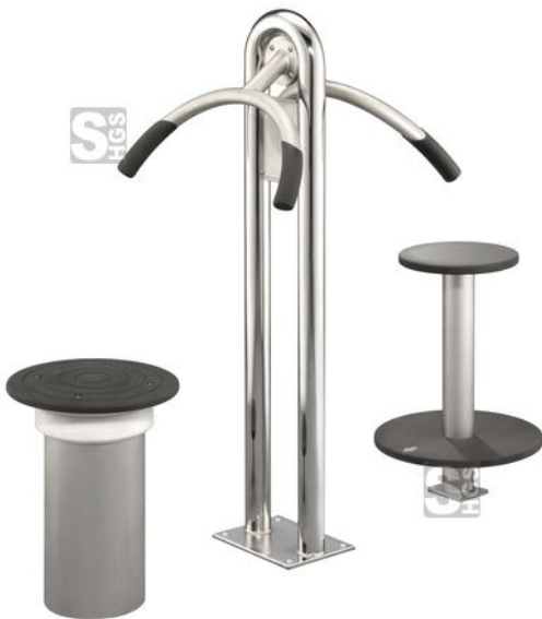
Modellbeispiel: Rückentrainer sitzend und Hüfttrainer (Art. 28179)