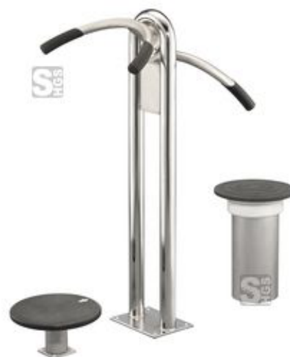
Modellbeispiel: Rückentrainer stehend und Hüfttrainer -Workout- (Art. 28178)

Anwendungsbereiche: Vereins-, Wohn-, Park-, Freizeit- und Sportanlagen, Firmen, Fußgängerzonen, Einkaufszentren, Hotels, Campingplätze, Kliniken, Wohngebiete etc.