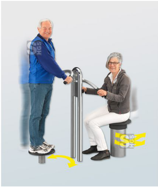
Anwendungsbeispiel: Rückentrainer stehend und Hüfttrainer