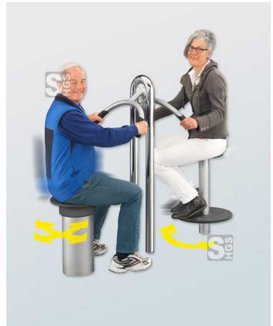
Anwendungsbeispiel: Rückentrainer sitzend und Hüfttrainer