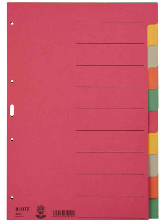
Intercalaires en carton extra solide, 10 touches, multicolore