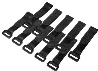
Attache-câbles auto-agrippante, 150 x 20 mm