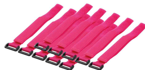
Attache-câbles velcro auto-agrippante, 500 x 20 mm