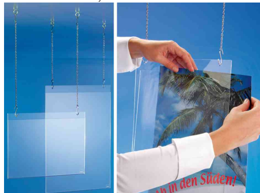
Plakattaschen - Anwendungsbeispiele