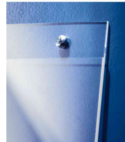
Auch zum Anschrauben an der Wand geeignet