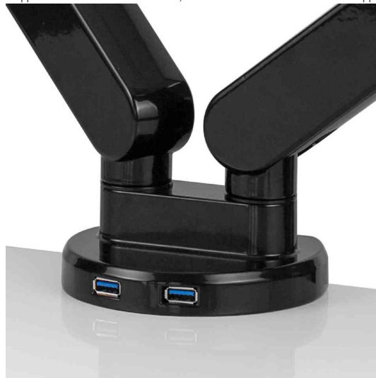
2 USB Ports an der Klemme