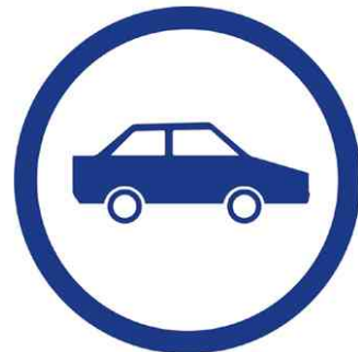
Ihre Vorteile auf einen Blick