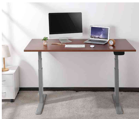
Visuel de référence: montre le produit en utilisation