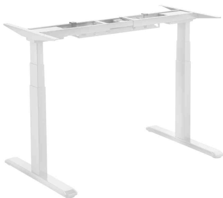
Piètement de bureau électrique, blanc