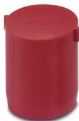
Verschlussstopfen, Material: PA, Farbe: rot

Bitte beachten Sie, dass die hier angegebenen Daten dem Online-Katalog entnommen sind. Die vollständigen Informationen und Daten entnehmen Sie bitte der Anwenderdokumentation. Es gelten die Allgemeinen Nutzungsbedingungen für Internet-Downloads. ( http://phoenixcontact.de/download )