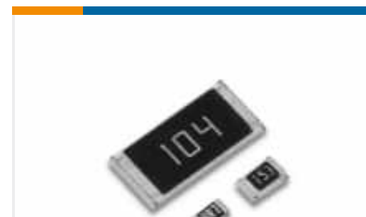
TE Teilnr.:1-2176339-7 CRGCO 0603 220R 1%