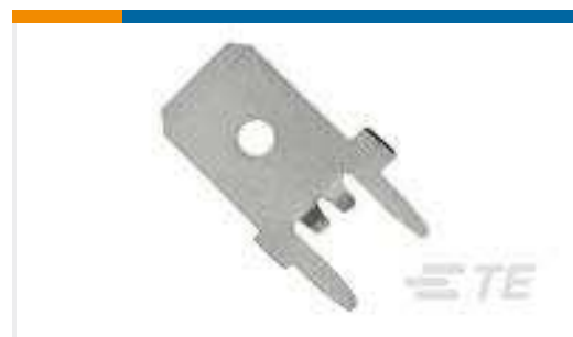
TE Teilnr.:63824-1 250 FASTON TAB TPBR