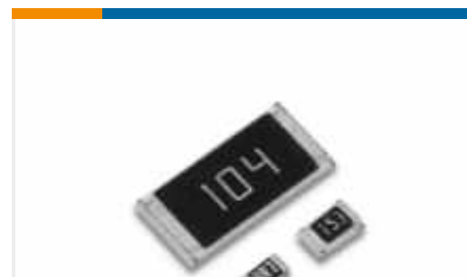
TE Teilnr.:2-2176339-5 CRGCO 0603 1K0 1%