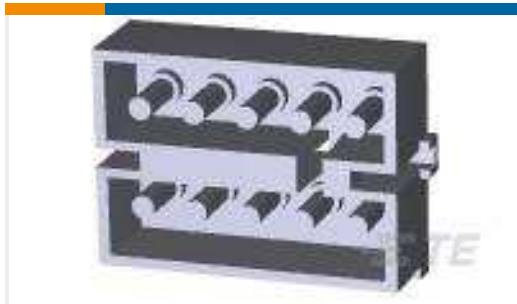
TE Teilnr.:1-380991-0 10P CMNL HDR ASSY NATL