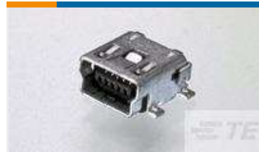
TE Teilnr.:1734035-4 MINI USB, TYPE B, R/A, SMT, MYLAR