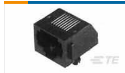
TE Teilnr.:5555162-1 MJ,LPF,R/A,8P,PNL STOPS