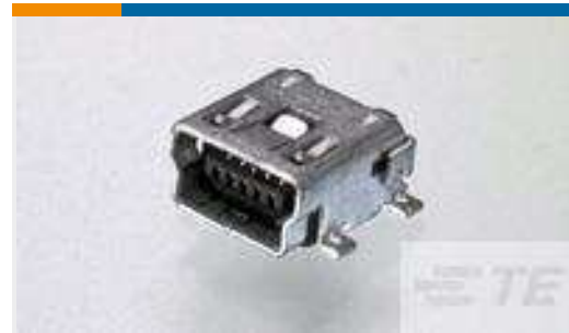
TE Teilnr.:1734035-2 MINI USB, TYPE B, R/A, SMT