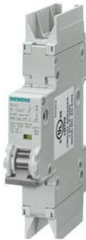
LEITUNGSSCHUTZSCHALTER 10KA, 1-POLIG, D, 13A NACH UL 489 - 277V