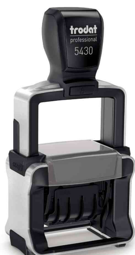
Tampon dateur Professional 4.0 5430