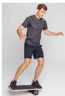
Visuel de référence; présente le produit en utilisation