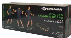
Balance Board Wave, emballage