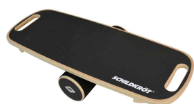
Balance Board Wave

- entraîne la coordination, l'équilibre et la concentration