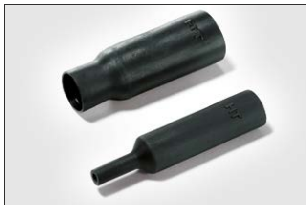
313E445-9 ungeschrumpft und vollständig geschrumpft.