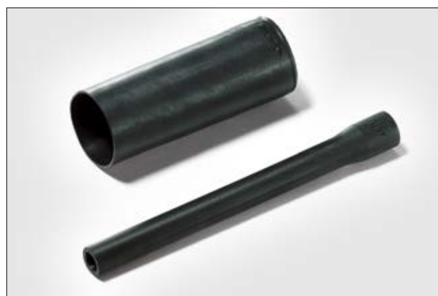
313F322-9 ungeschrumpft und vollständig geschrumpft.