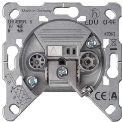
DELTA GERAETEEINSATZ ANTENNEN- STICHLEITUNGSDOSE AUCH FUER BREITBAND